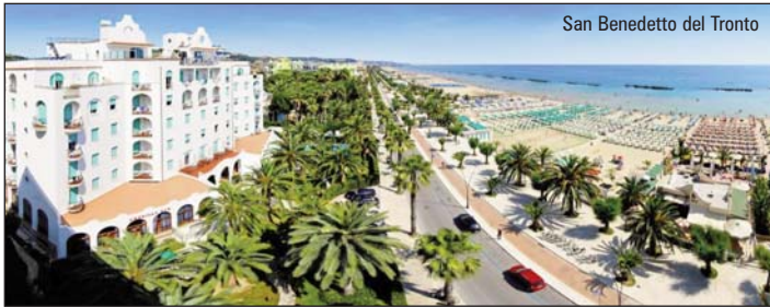
San Benedetto del Tronto