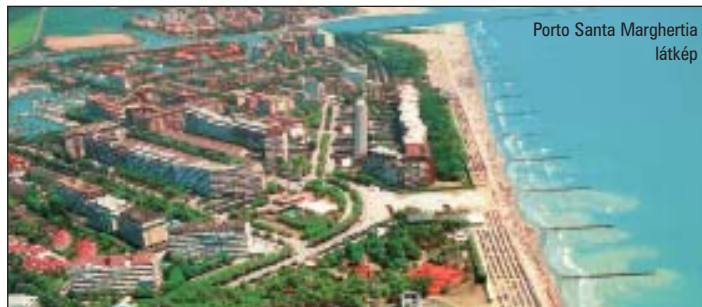
Porto Santa Margherita látkép